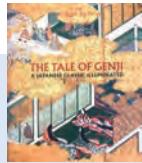
NYメトロポリタン美術館 「The Tale of Genji (源氏物語展)」(2019)